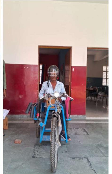
विजय एकेडमी ऑफ़ लर्निंग समिति द्वारा निःशुल्क सहायक उपकरण वितरण कार्यक्रम 2025-26