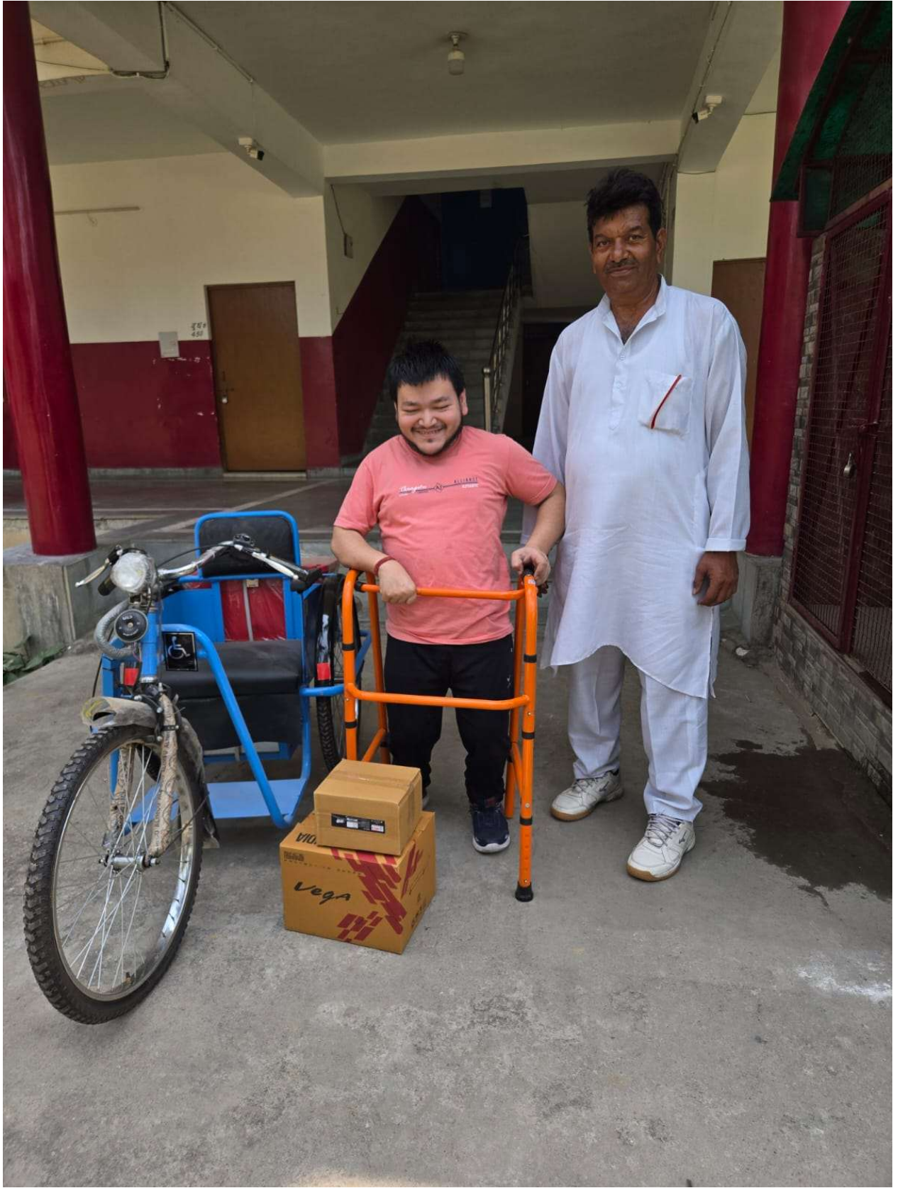
विजय एकेडमी ऑफ़ लर्निंग समिति द्वारा निःशुल्क सहायक उपकरण वितरण कार्यक्रम 2025-26