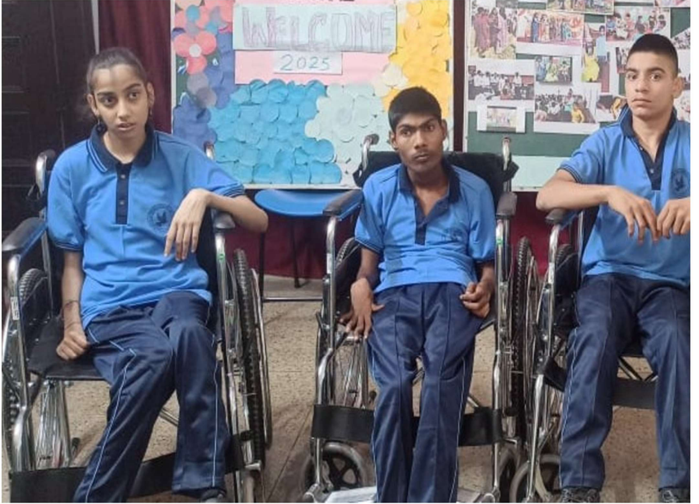
विजय एकेडमी ऑफ़ लर्निंग समिति द्वारा निःशुल्क सहायक उपकरण वितरण कार्यक्रम 2025-26