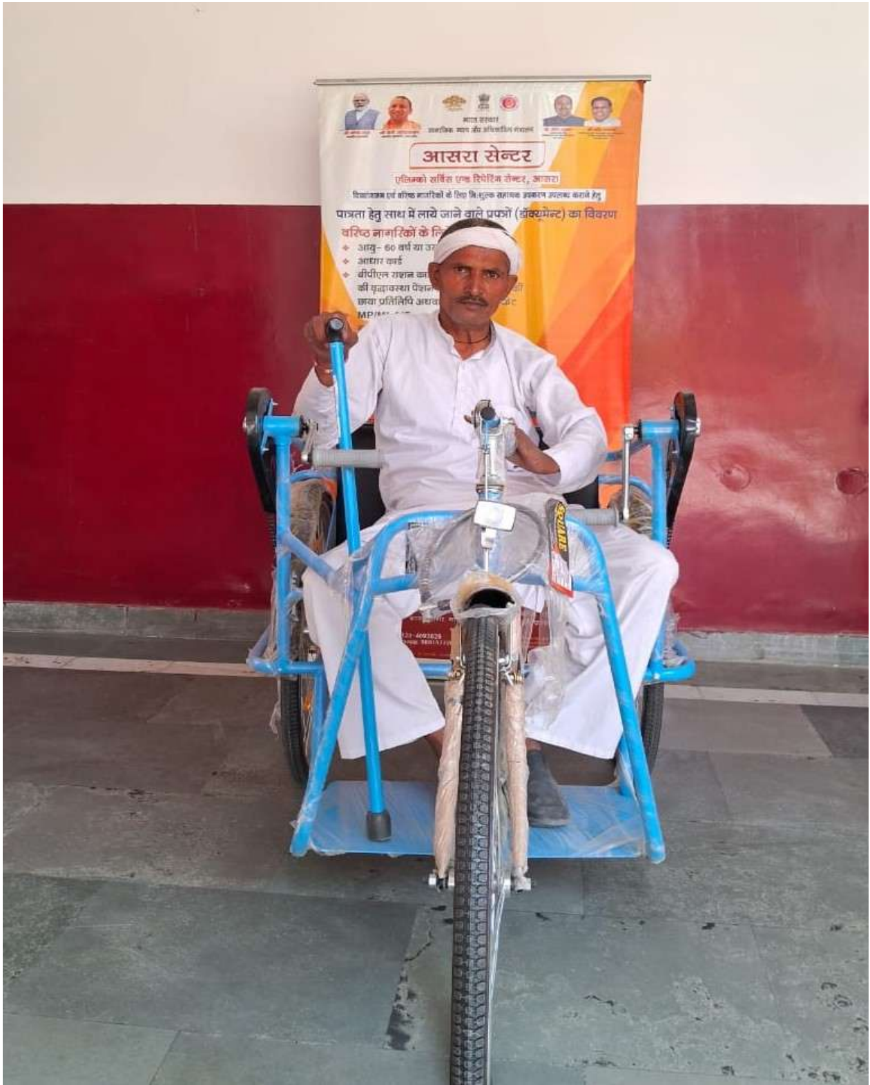
विजय एकेडमी ऑफ लर्निंग समिति द्वारा निःशुल्क सहायक उपकरण वितरण कार्यक्रम 2025-26